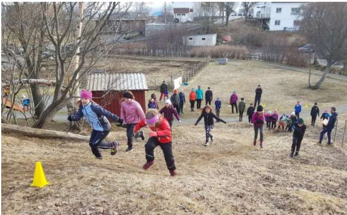
Motbakkeløping ved 4H-gården