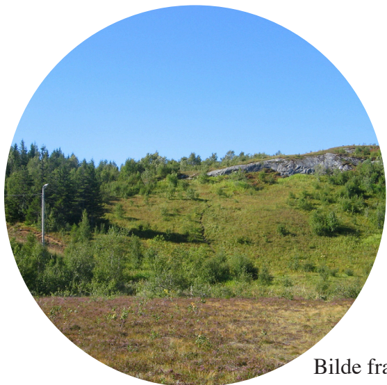
Bilde fra terrenget

PÅMELDING for begge løp: via kretsens hjemmeside www.nook.no innen 9.september.